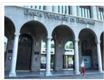
Banca Popolare di Bergamo

Mercoledì, 10 Luglio 2013 09:59 dimensione font Stampa Email