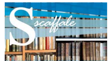
FOTO DELLA SETTIMANA