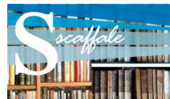
FOTO DELLA SETTIMANA